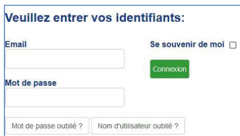
Figure 4 : Formulaire de connexion

L'utilisateur a la possibilité de se connecter via le bouton en page d'accueil Connectez-vous ou via le menu en haut à droite du site.