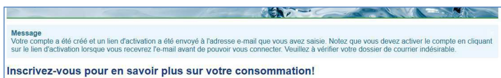
Figure 3 : Confirmation d'inscription

Lorsque tout le formulaire sera correctement rempli et validé via le bouton S'inscrire , un message de confirmation l'invitant à valider son compte via un lien reçu par email s'affichera :