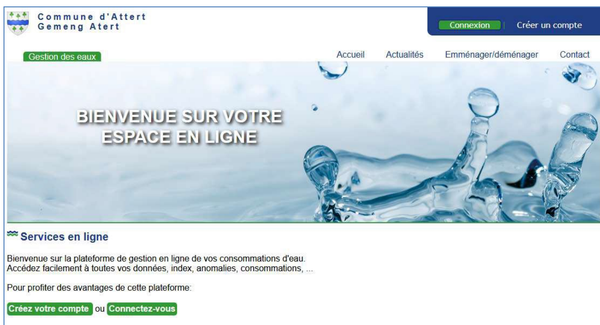
Figure 1 : Page d'accueil

Il est possible pour un utilisateur de récupérer son mot de passe via une procédure traditionnelle de lien par retour de mail (voir fiche « Comment récupérer mon mot de passe ? »).